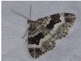
Epirrhoe alternata , Beaumonts 30 septembre 2022.

Enfin une Boarmie rhomboïdale ou Boarmie commune , Peribatodes rhomboidaria (Denis et Schiffermüller, 1775), un peu « frottée », ayant perdu une partie des écailles qui ornent les ailes, s'est posée vers la fin de la session. Cette espèce est très courante. On peut aussi la rencontrer sur les murs en ville. Les antennes pectinées sont l'apanage du mâle. Elles augmentent la sensibilité de réception des phéromones émises par les femelles. On remarquera que chez cette espèce la pectination s'arrête nettement avant l'apex de l'antenne. Espèce bivoltine, on la trouve de mai à octobre. La chenille est polyphage.