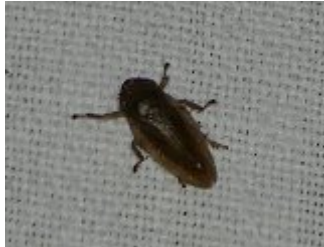
Philaenus spumarius , Beaumonts, 30 septembre 2022

Les larves de cicadelles percent avec leur rostre les végétaux pour se nourrir. Pour se protéger de prédateurs potentiels elles forment un amas de bulles qui les recouvrent entièrement comme chez les Cercopes. Cette masse de bulles est désignée par « crachat de coucou ». En effet l'apparition de ces amas serait synchrone de l'arrivée des coucous.