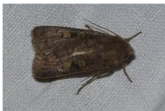
Xestia xanthographa , Beaumonts, 30 septembre 2022 ; cliché André Lantz.

Une autre espèce automnale, déjà photographiée de jour dans le parc en 2019, s'est posée sur le drap. Il y a eu deux ou trois imagos. Il s'agit de la noctuelle Xestia xanthographa (Denis et Schiffermüller, 1775) : La Ségétie trimaculée ou la Trimaculée . L'aile antérieure est brun grisâtre. Les ligne transverses sont peu nettes, La tache réniforme blanchâtre et bien nette, l'orbiculaire plus estompée est roussâtre plus ou moins clair. Les postérieures sont blanchâtres et présentent une bordure grise. Il existe de nombreuses formes avec diverses colorations des ailes antérieures allant du noirâtre au gris et à l'ocre.