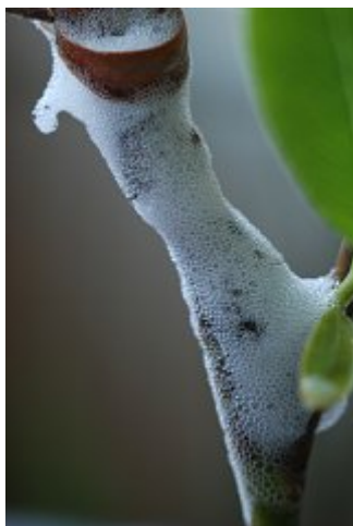
Crachat de coucou sur saule, Beaumonts, 19 mai 2010 ; cliché André Lantz.

Les larves de cicadelles percent avec leur rostre les végétaux pour se nourrir. Pour se protéger de prédateurs potentiels elles forment un amas de bulles qui les recouvrent entièrement comme chez les Cercopes. Cette masse de bulles est désignée par « crachat de coucou ». En effet l'apparition de ces amas serait synchrone de l'arrivée des coucous.