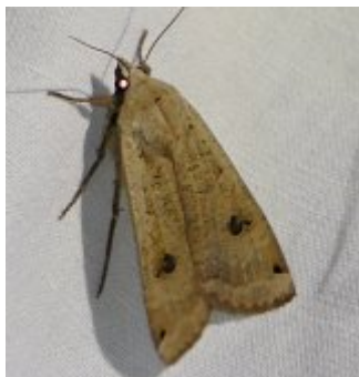
Noctua pronuba , Beaumonts, 30 septembre 2022.