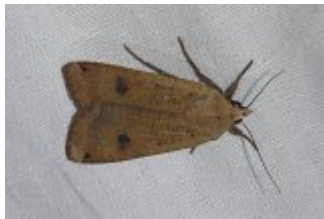
Noctua pronuba , Beaumonts, 30 septembre 2022