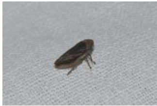
Philaenus spumarius , Beaumonts, 30 septembre 2022