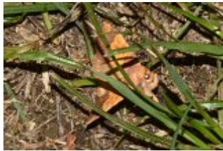
Tiliacea aurago , Beaumonts, 30 septembre 2022 ; cliché André Lantz.