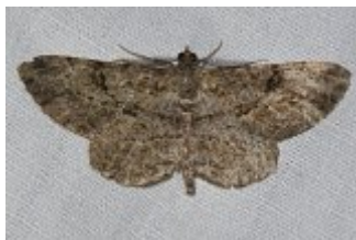
Peribatodes rhomboidaria , Beaumonts, 30 septembre 2022, cliché André Lantz.

Enfin une Boarmie rhomboïdale ou Boarmie commune , Peribatodes rhomboidaria (Denis et Schiffermüller, 1775), un peu « frottée », ayant perdu une partie des écailles qui ornent les ailes, s'est posée vers la fin de la session. Cette espèce est très courante. On peut aussi la rencontrer sur les murs en ville. Les antennes pectinées sont l'apanage du mâle. Elles augmentent la sensibilité de réception des phéromones émises par les femelles. On remarquera que chez cette espèce la pectination s'arrête nettement avant l'apex de l'antenne. Espèce bivoltine, on la trouve de mai à octobre. La chenille est polyphage.