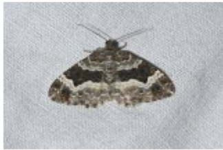
Epirrhoe alternata , Beaumonts 30 septembre 2022, clichés André Lantz.