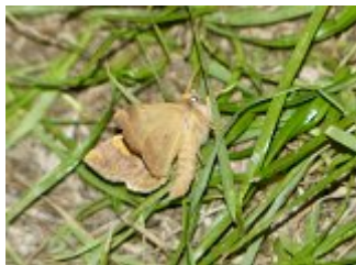
Tiliacea aurago , Beaumonts, 30 septembre 2022.

Chez certaines noctuelles certains dessins caractéristiques aident à la détermination. En particulier on peut s'intéresser à deux taches particulières sur l'aile antérieure : La première située à environ 1/3 à partir du point d'attache de l'aile au thorax et positionnée vers le bord antérieur de l'aile (côte) est la tache orbiculaire (en forme de rond), la seconde aux environs des 2/3 est la tache réniforme (en forme de rein).