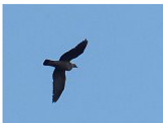
Pigeon ramier, Montreuil-Molière, 19 décembre 2013.

Il y a des déplacements quotidiens en masse, mais variables suivant les périodes avec, par exemple, un flux matinal vers l'ENE et un retour commençant vers 15h.