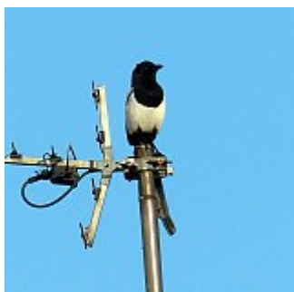
Pie bavarde, Montreuil-Molière, 2 janvier 2013.

Quelques individus présents toute l'année. Noté un groupe de sept le 20 septembre.