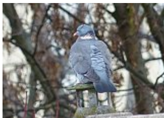
Pigeon ramier, Montreuil-Molière, 25 décembre 2013.