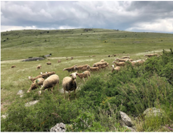
Paysage du Causse nu pâturé par un troupeau de brebis au printemps 2023.

Ces différences constatées entre chevaux domestiques et « sauvages » pourraient être reliées à la libre expression des interactions sociales conduisant à une socialité typique chez les chevaux de Przewalski, qui forment ainsi des groupes familiaux (harem) pérennes. Cette formation de groupes pourrait de fait entraîner une utilisation du milieu différente des troupeaux d'animaux domestiques.