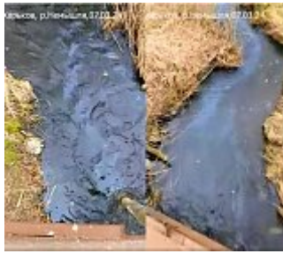
Rivières et sources empoisonnées de Kharkiv

Dans la plaine où la tragédie s'est produite, une petite rivière, la Nemyshlya, se jette dans la rivière Kharkiv. Elle se jette dans le Lopan, le Lopan dans l'Udy, et l'Udy dans le Seversky Donets, c'est-à-dire l'une des principales voies navigables de l'est du pays, qui alimente en eau la région de Donetsk. Les autorités régionales affirment que la pollution du Donets a été évitée, mais dans d'autres rivières, l'eau a été littéralement noircie par les produits pétroliers. Le 14 février, l'Inspection nationale de l'environnement a indiqué que la concentration de produits pétroliers dans ces trois rivières était 7 à 8 fois supérieure à la norme, et dans la Nemyshlya, 95 fois. Sur les réseaux sociaux de la ville on peut lire :