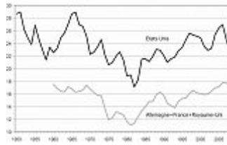
Graphique 1: Le taux de profit aux États-Unis et en Europe

A cette position « haussière » s’oppose une analyse « baissière » (pour employer les termes les plus neutres possibles, empruntés ici au langage boursier) qui conteste ce schéma et avance d’autres évaluations du taux de profit, qui ne font pas apparaître de tendance à la hausse depuis le début des années 1980. L’éventail est d’ailleurs assez large, puisqu’il va d’une augmentation moins nette à la baisse tendancielle, en passant par l’encéphalogramme plat.